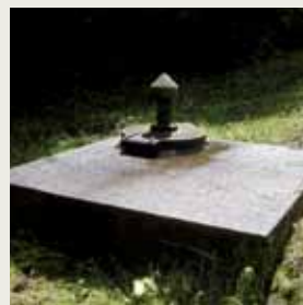
Le protocole a été signé le 31 octobre 2005